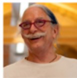
Dr. Patch Hunter Adams